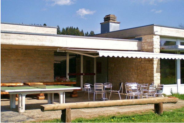
Studienheim, La Ferrière www.studienheim.ch