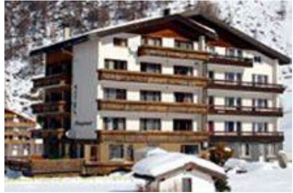
Maison Almagellerhof Saas-Almagell