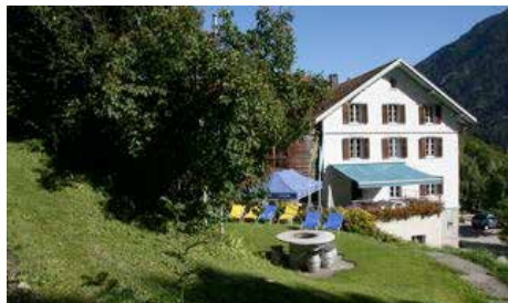
Maison Fontana Passugg www.fontana-passugg.ch