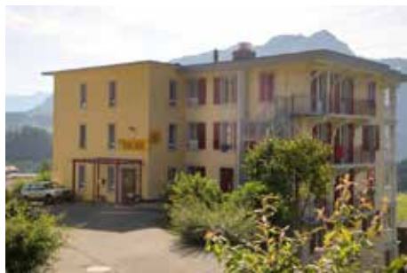
Maison Beau-Soleil, Leysin www.bsleysin.ch