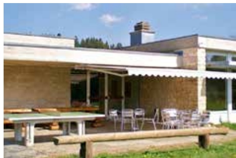
Studienheim, la Ferrière www.studienheim.ch