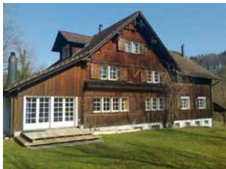
Maison Löchli, Niederglatt www.loechli.ch