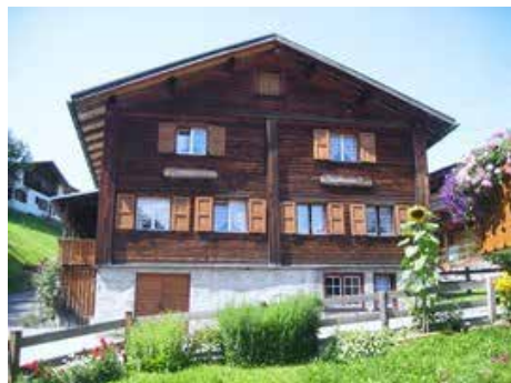
Ferienhaus Cresta, Conters i. Prätigau www.ferienhaus-cresta.ch