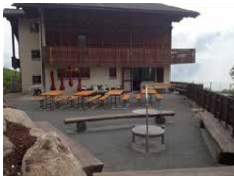
Ferienhaus Schnäls, Flumserberg www.ferienhaus-schnaels.ch