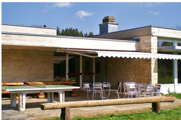
Studienheim, La Ferrière www.studienheim.ch