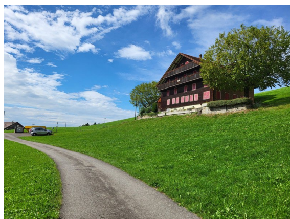
Ferienhaus Mattli Oberägeri